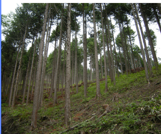
分収造林事業により育林中の森林